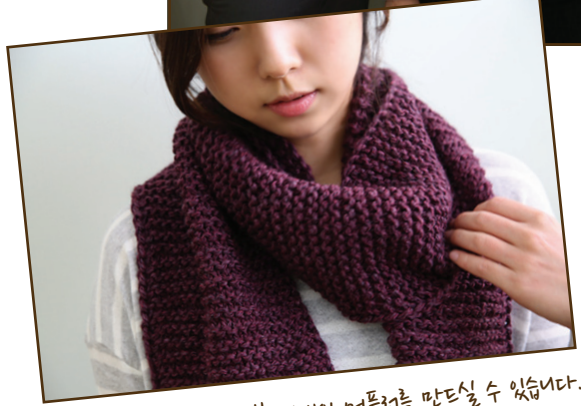
죽4볼로 1개의 머플러를 만드실 수 있습니다.